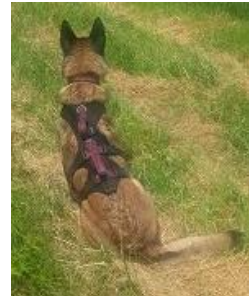
Auf 'Nummer sicher' mit Geschirr